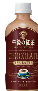
キリン 午後の紅茶 TEA SELECTION チョコレートティーラテ